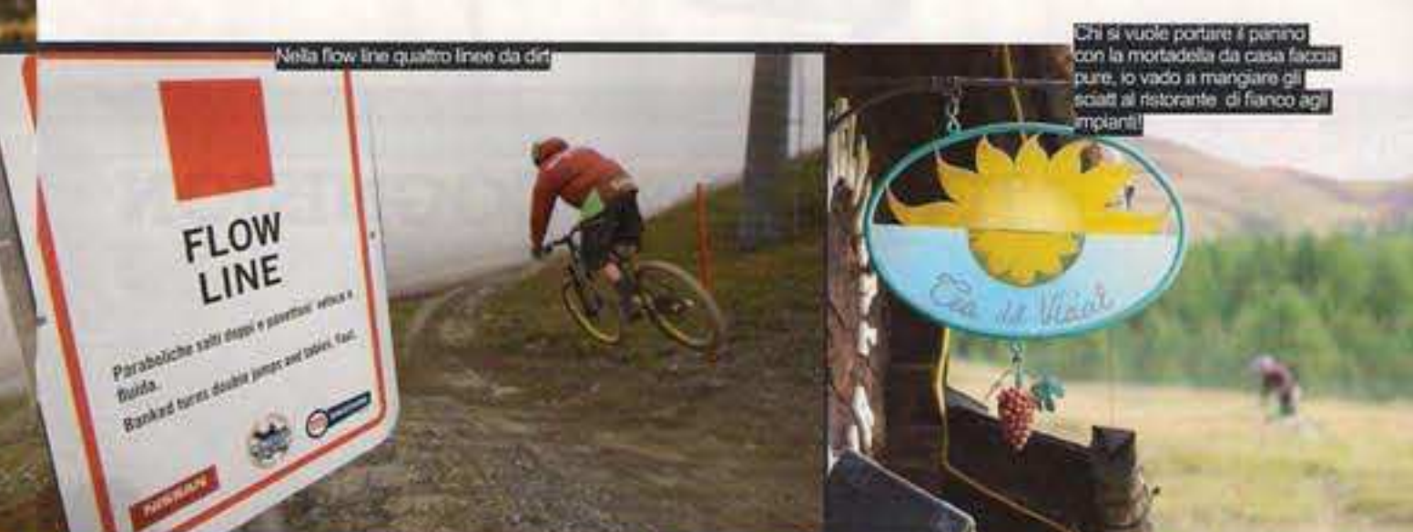
Nella flow line quattro linee da dirt