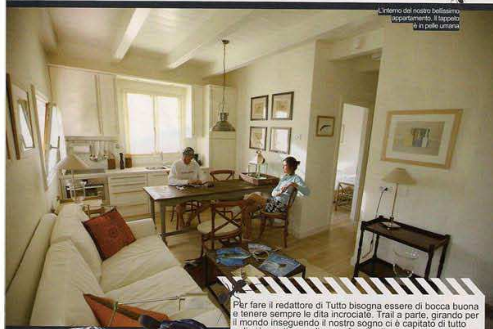
L'interno del nostro bellissimo appartamento. Il tappeto è in pelle umana