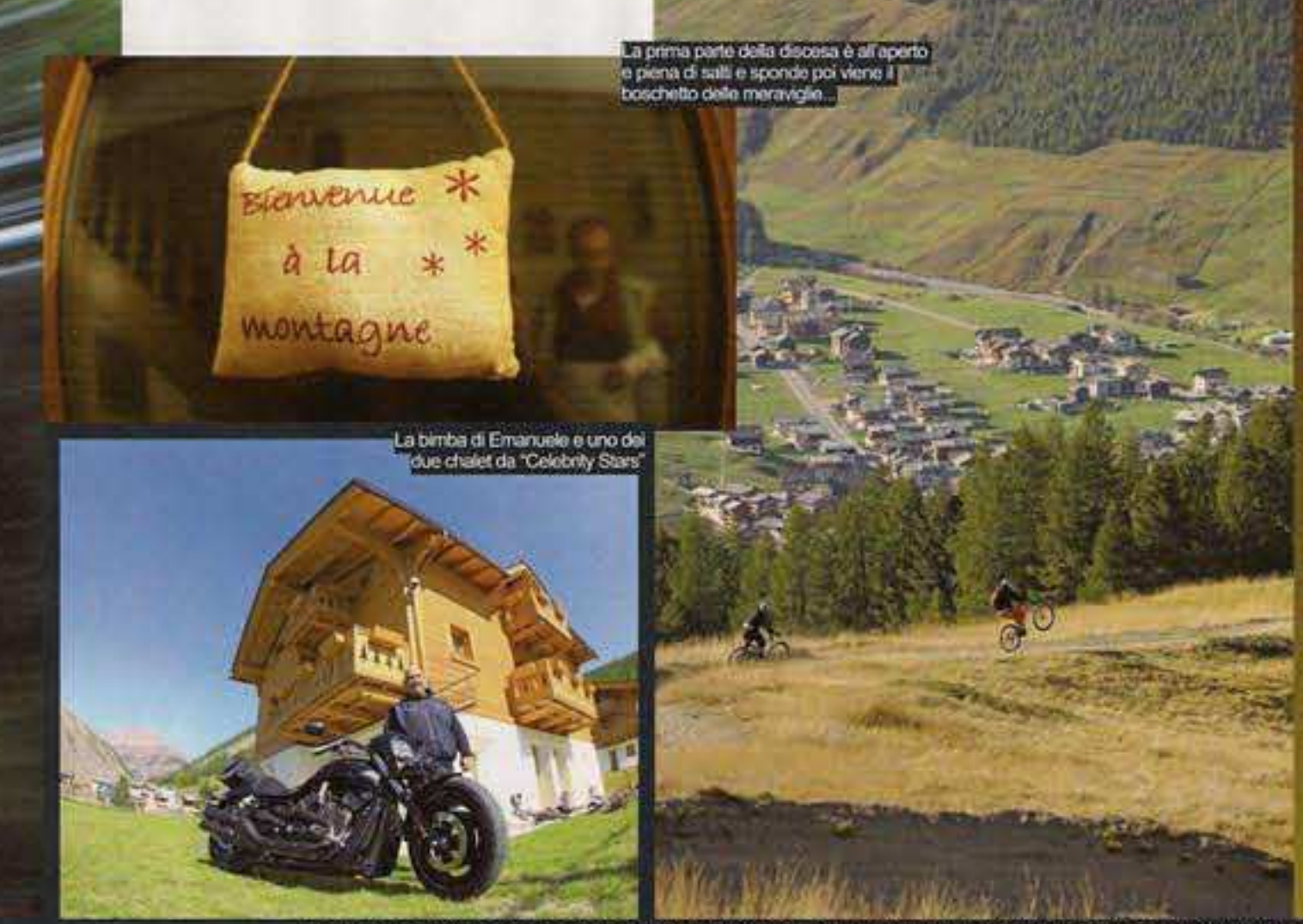
La prima parte della discesa è all'aperto e piena di salti e sponde poi viene il "tocchetto della meraviglia"