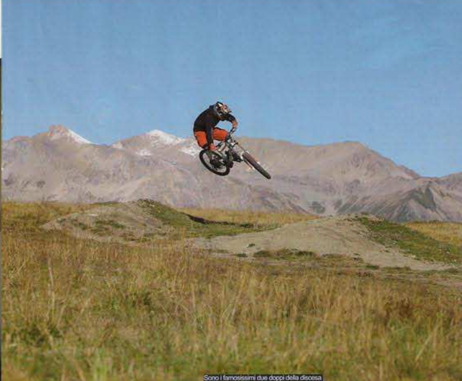
Sono i famosissimi due doppi della discesa principale, uno spettacolo per la loro technicalità

e troviamo al primo colpo il luogo che ci ospiterà per tre giorni che si preannunciano "da favola". Al nostro arrivo ci fanno accomodare nei garage, riscaldati ovviamente, scarchiamo subito le bimbe che vengono riposte in gabbie chiuse e video sorvegliate, sarà una festa da noi biker, ma sapere che il gioiello è al sicuro ci dà quella sicurezza e allegria in più. Ci vengono consegnate delle tessere magnetiche con le quali abbiamo accesso a tutto, ascensore per primo, così scarichiamo anche i bagagli e ci dirigiamo verso l'ascensore. Già nel garage avevamo notato un aspetto sconosciuto alle nostre abitazioni, tutto è perfettamente pulito e immacolato, quando entriamo in ascensore sembra di stare nella sala operatoria di Rip & Tuck: all white. Passiamo la