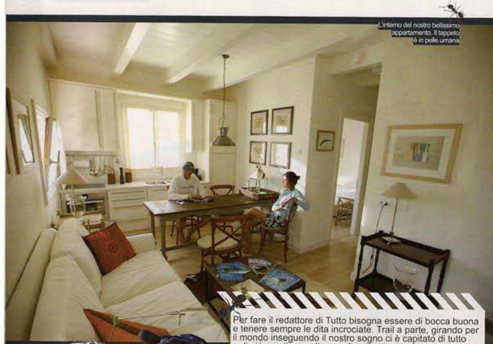
L'interno del nostro bellissimo appartamento. Il tappeto è in pelle umana