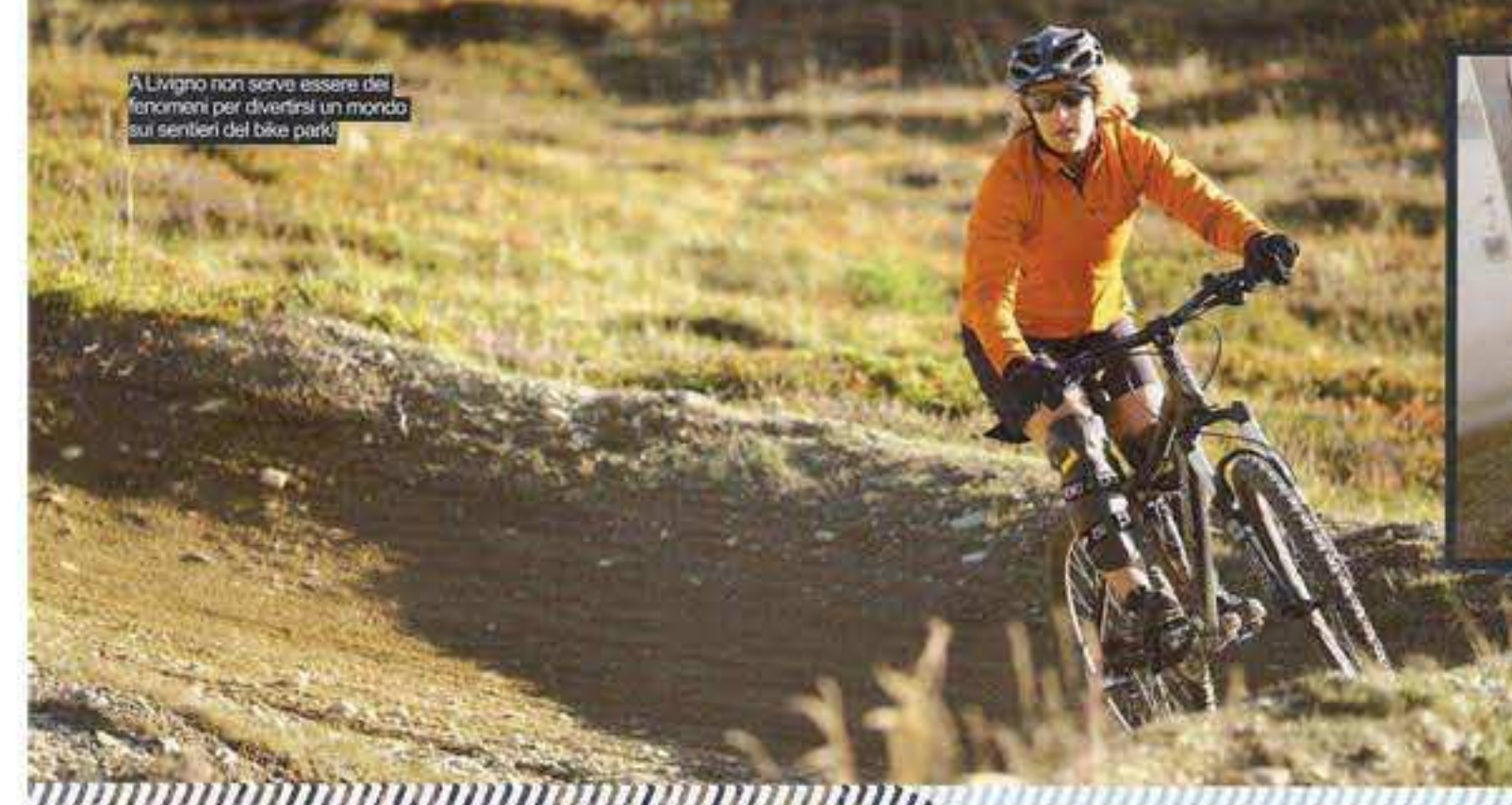
A Livigno non serve essere dei fanoniani per divertirsi un mondo sui sentieri dal bike park