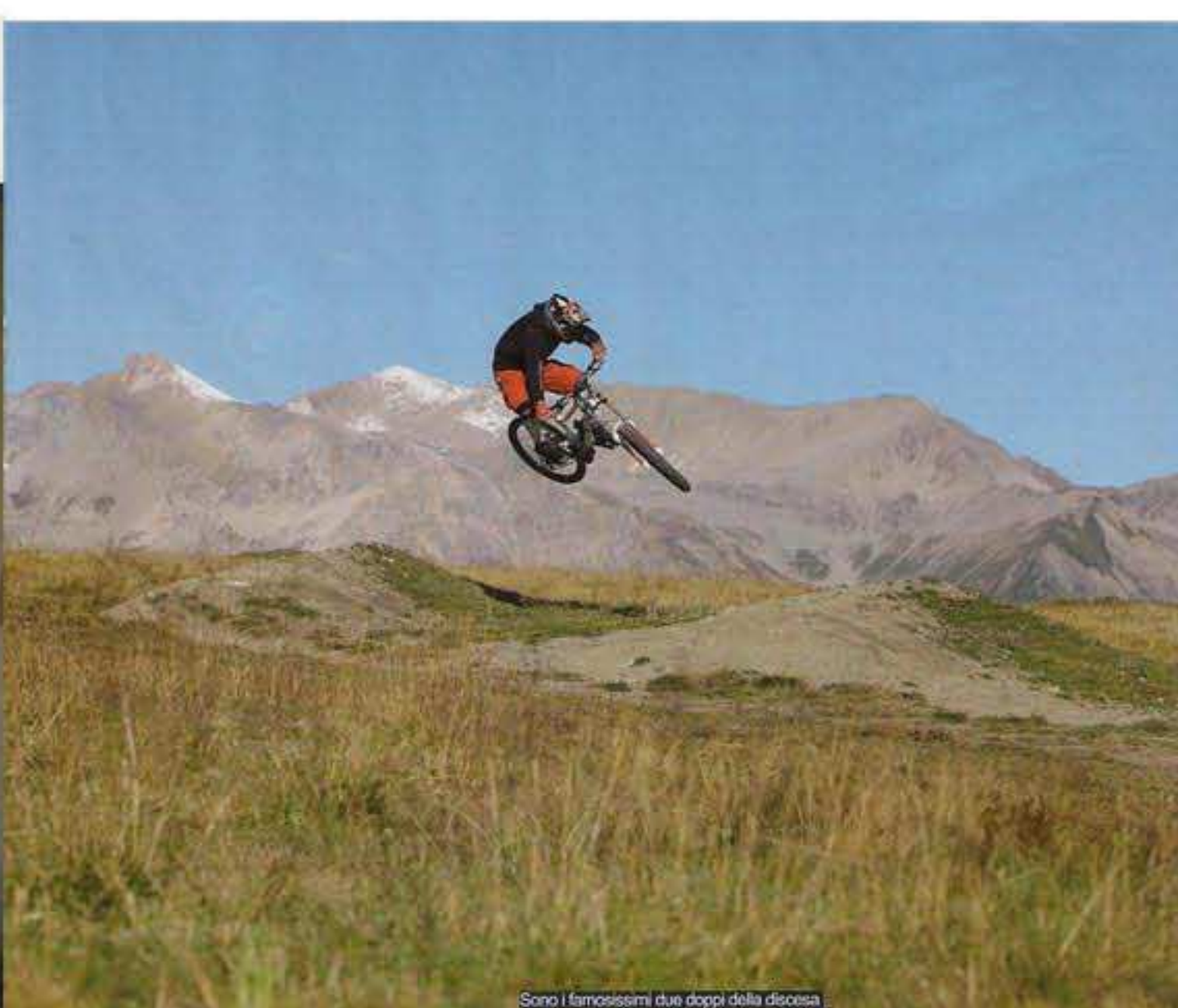
Sono i famosissimi due doppi della discesa principale, uno spettacolo per la loro technicalità

e troviamo al primo colpo il luogo che ci ospiterà per tre giorni che si preannunciano "da favola". Al nostro arrivo ci fanno accomodare nei garage, riscaldati ovviamente, scarichiamo subito le bimbe che vengono riposte in gabbie chiuse e video sorvegliate, sarà una festa da noi biker, ma sapere che il gioiello è al sicuro ci dà quella sicurezza e allegria in più. Ci vengono consegnate delle tessere magnetiche con le quali abbiamo accesso a tutto, ascensore per primo, così scarichiamo anche i bagagli e ci dirigiamo verso l'ascensore. Già nel garage avevamo notato un aspetto sconosciuto alle nostre abitazioni, tutto è perfettamente pulito e immacolato, quando entriamo in ascensore sembra di stare nella sala operatoria di Rip & Tuck: all white. Passiamo la