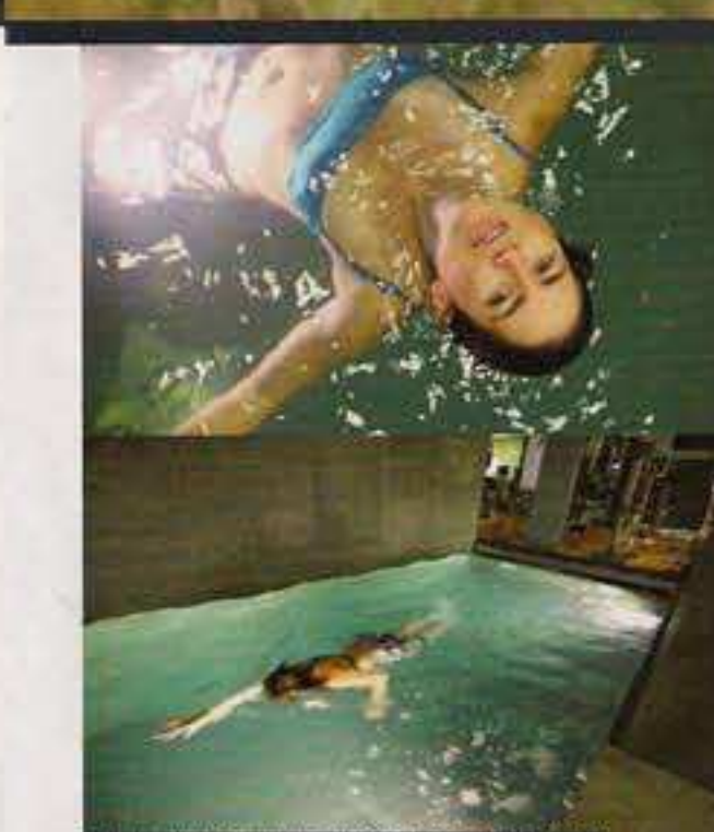
Potrete scegliere se fare qualche braccata o nuotare stando fermi grazie a due potentissimi idromobili

tessera magnetica sul sensore e automaticamente ci troviamo... non in un corridoio, ma direttamente nel nostro appartamento. Ora mi tocca fare una micro premessa. Nella mia vita sono sempre stato fortunato, perché di strutture belle ne ho viste parecchie, così mai. Questi due grossi chalet hanno all'interno pochi appartamenti, dannatamente lussuosi e perfetti in ogni dettaglio, poi scopriamo che sono stati disegnati da una designer famosissima, te credo... Sono quasi imbarazzato ad appoggiare il mio borsone della bici che di certo non è la cosa più pulita su questa terra. Diamo un occhio all'appartamento, è più grande di quello in cui vivo e c'è così tanto travertino nei bagni che mi viene subito da fargli i conti in tasca, visto che una lastra da un metro e mezzo per la cucina mi è costata 1.200 euro. Nel nostro appartamento immacolato (non il mio eh...) ci sono due camere, come direbbe la mia compagna, "carissime", due bagni, una cucina a vista che farebbe impazzire anche Lorella Cuccarini e un salottino molto accogliente: Neanche da chiederlo... tv piatta da 32", Mp3 con già caricate centinaia di canzoni, film e internet. Dimenticavo, i piumoni sono quelli alti due spanne, da schiacciare coi battipanni se si vuole vedere la tv a letto! Ma ragazzi non è finita, abbandonati i bagagli ancora intonsi scendiamo al piano -1, dove si trova un vero e proprio centro wellness concepito con i più alti canoni del gusto. Tutte pietre naturali che alla sola visione ci fanno